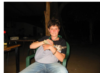
Voyage en famille à la ferme Myella

L'Australie est un terrain de jeu géant pour les petits et les grands. A tout âge, on rêve de voir un kangourou , un koala ou une baleine . A n'importe quelle saison de l'année, il y a toujours un endroit où vous serez